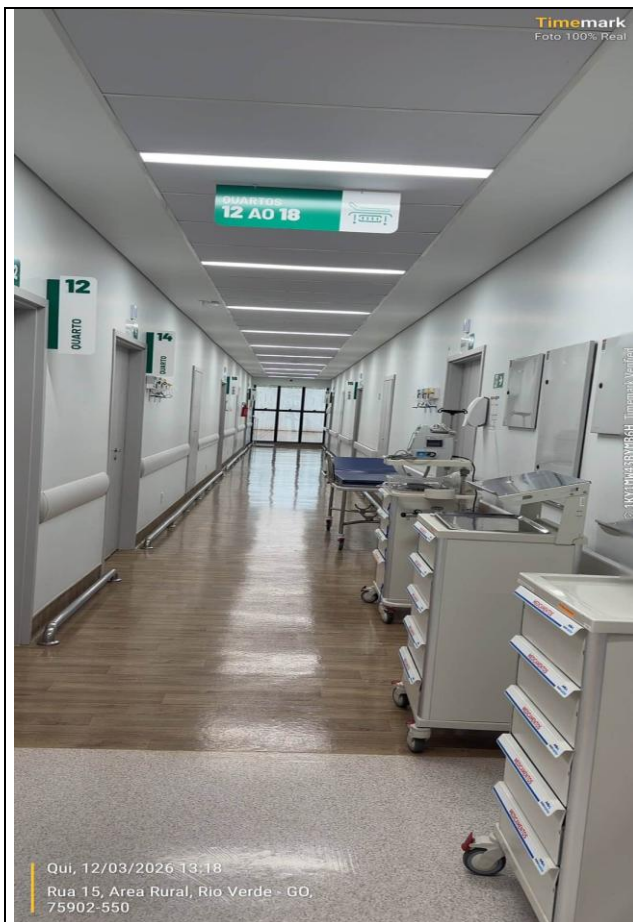
CORREDOR - CLINICA MEDICA