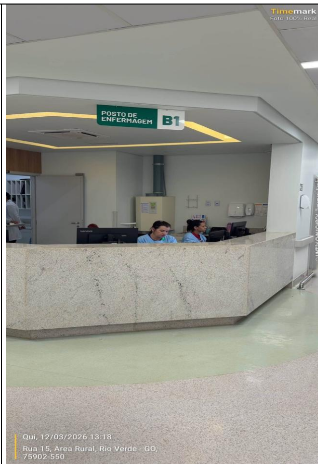
POSTO - CLINICA MÉDICA