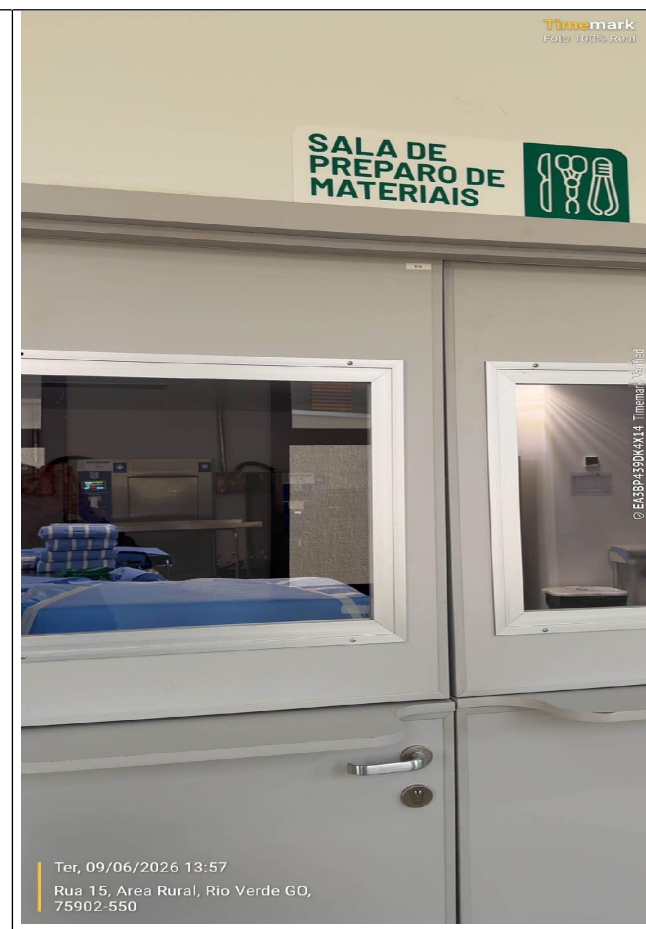
SALA DE PREPARO DE MATERIAIS