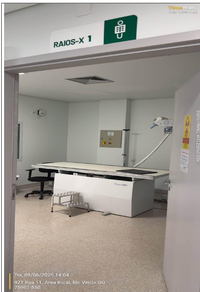
SALA DE RAIOS-X